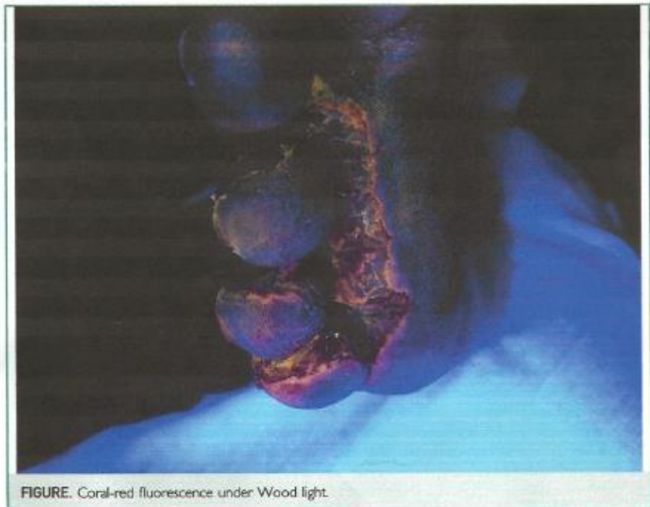
FIGURE. Coral-red fluorescence under Wood light.

In interdigital foot maceration, the combined use of direct microscopy under potassium hydroxide 20%, Gram staining, and